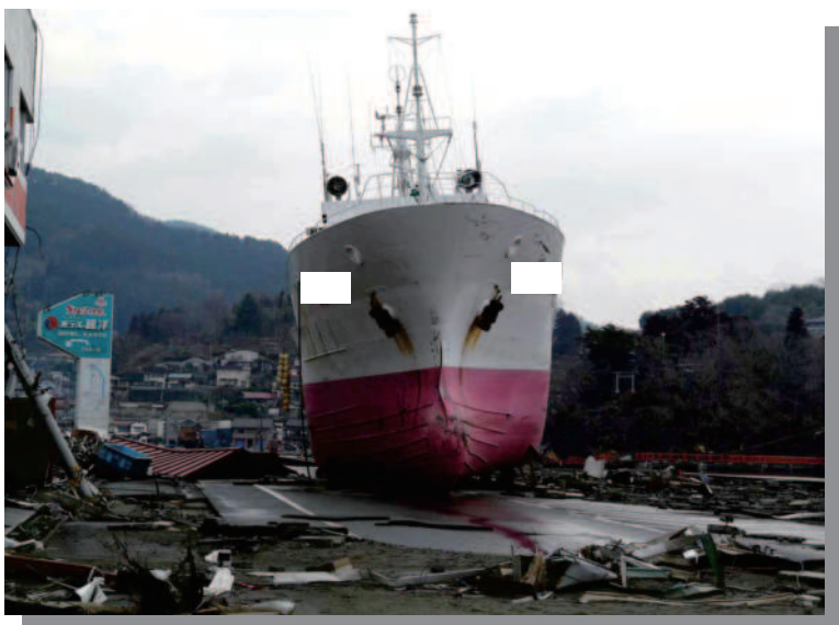
10.8 気仙沼 打ち上げられた大型漁船