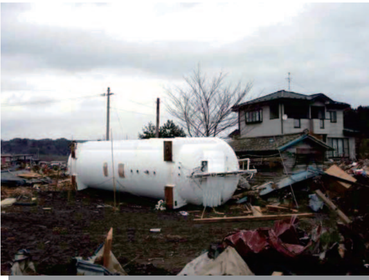
9.9 宮古 流出したLPG貯槽