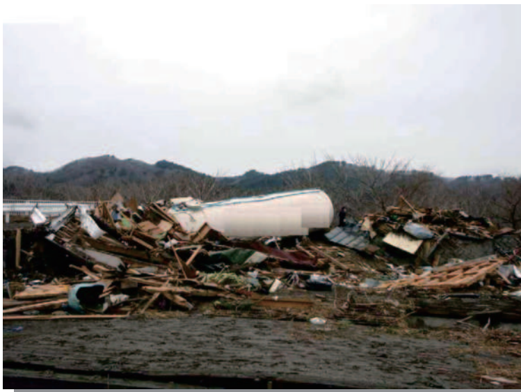
9.10 宮古 流出したLPガス貯槽