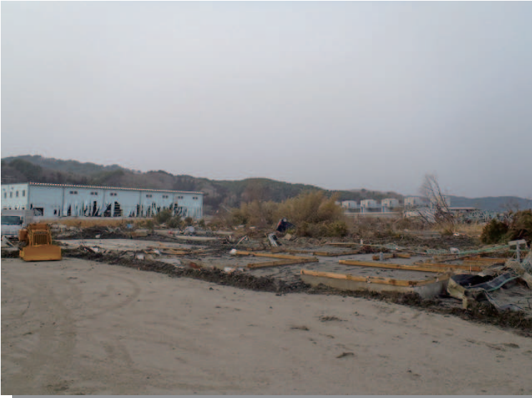
9.7 宮古 充填所事務所跡（震災後）