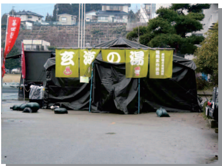
10.10 気仙沼 自衛隊の仮設風呂