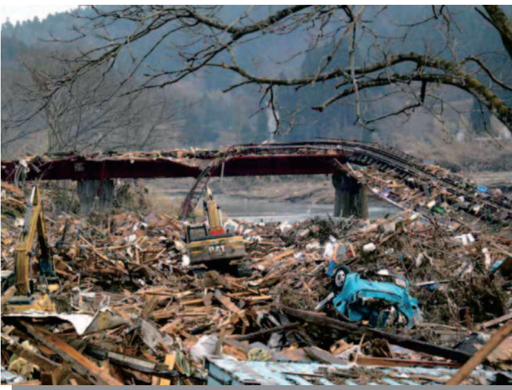
8.6 陸前高田 津波により被災した三陸鉄道の線路