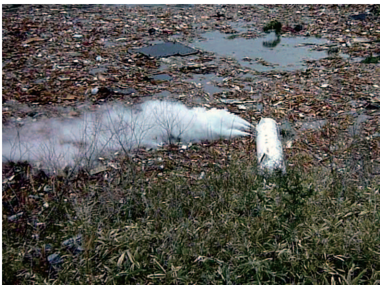
8.7 陸前高田 流出し、LPGを放出する貯槽