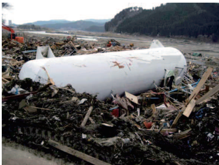
8.8 陸前高田 流出したLPG貯槽