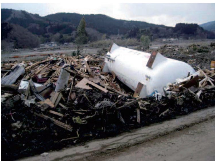
8.8 陸前高田 流出したLPG貯槽