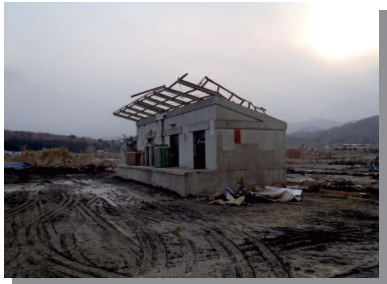
9.8 宮古 一般ガス容器置場（震災後）