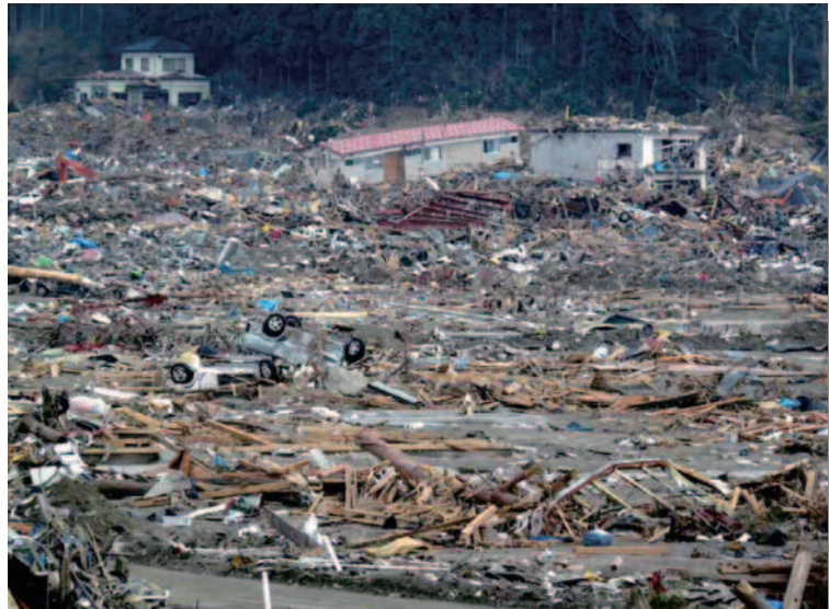
8.5 陸前高田 津波により被災した市街地