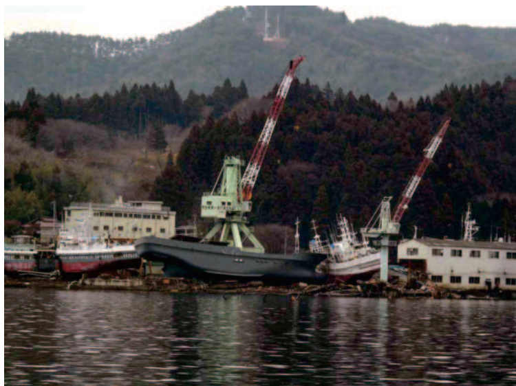
10.9 気仙沼 被災した造船所