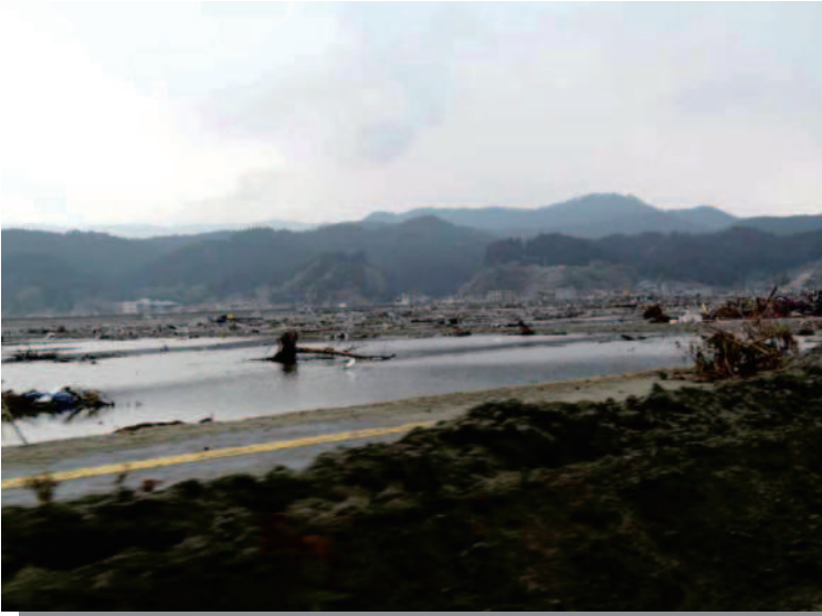
8.4 陸前高田 地震により沈下した市街地